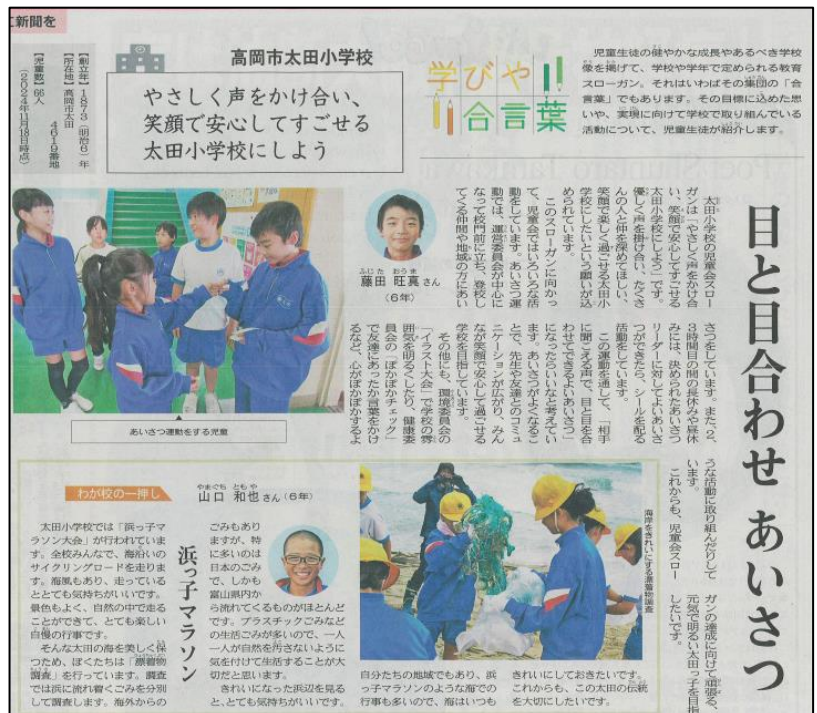
【12月4日付 北日本新聞より】

右の新聞記事は、先日北日本新聞で紹介された太田小学校の記事です。太田小学校の「ええところ」が紹介されています。